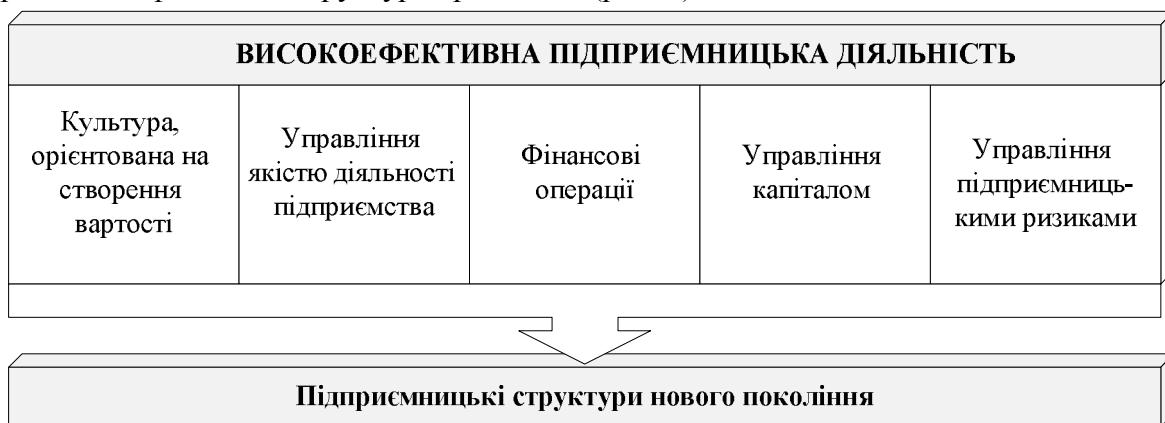
Рис. 2. Організація високоефективної фінансової діяльності

У процесі виконання фінансової роботи виникає сукупність конфліктів і проблем, що потребують негайного вирішення і можуть спричинити ланцюгову реакцію, здатну призвести до втрати доходів (прибутків, капіталу). Зокрема, за дослідженнями М. Саткліфа та М. Доннеллана, більшість підприємств у своїй діяльності мають конфлікт у двох сферах [10]. А отже, на їх думку, значна увага повинна приділятися керівництву і стратегії, при цьому одночасно зосереджуватися увага на базових функціях фінансової діяльності і бухгалтерського обліку. Їхні дослідження на базі Accenture (консалтингової компанії, що надавала послуги організаціям щодо консультування у сферах стратегічного планування, оптимізації й організації аутсорсинга бізнес-процесів, управління взаємозв'язків з клієнтами, менеджменту персоналу, запровадження інформаційних технологій, управління логістикою тощо) дали змогу виділити такі п'ять ключових фінансових здібностей, які позитивно впливають на якість діяльності підприємства і можуть бути представлені у вигляді стовпців (колон), на яких тримається фінансова структура організації (рис. 2).