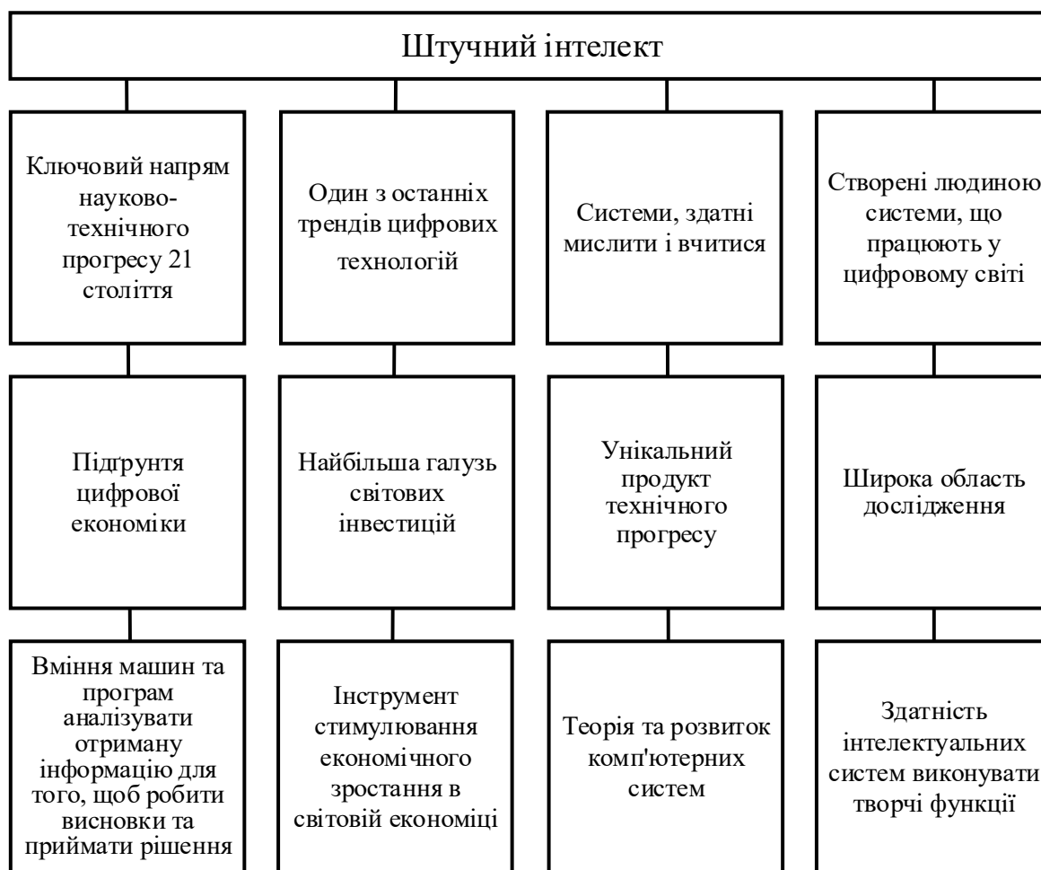
Рис. 1. Сутність штучного інтелекту

Нині є різні підходи до визначення ШІ (рис. 1), який можна розглядати як систему, різновид цифрових технологій, галузь досліджень тощо.