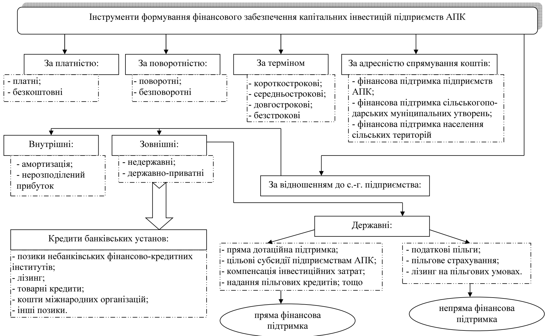
Рис. 2. Інструменти формування фінансового забезпечення капітальних інвестицій підприємств АПК